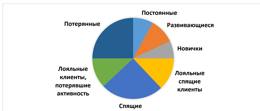
Рис. 1. Сегменты клиентов спа-салона