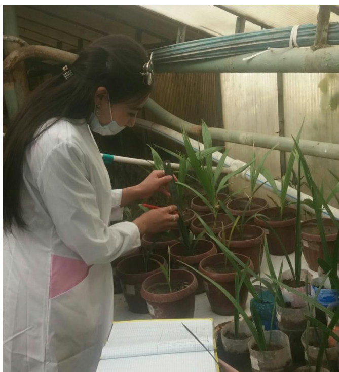
Фото 1. Финиковая пальма

Многие пальмы имеют съедобные плоды или семена. Кокосовый орех, финики, плоды пальмы – основной продукт питания миллионов людей. Плоды ряда пальм используются для приготовления вина (Например финиковой пальмы). Плоды пальм также служат кормом для домашних животных. За тысячелетия до нашей эры она возделывалась в Египте, Аравии и других странах Средиземноморья. И в географическом распространении и во всем своем историческом развитии культура – финиковой пальмы приурочена к пустыням, являясь типичнейшей культурой оазисного земледелия (фото 1-2).