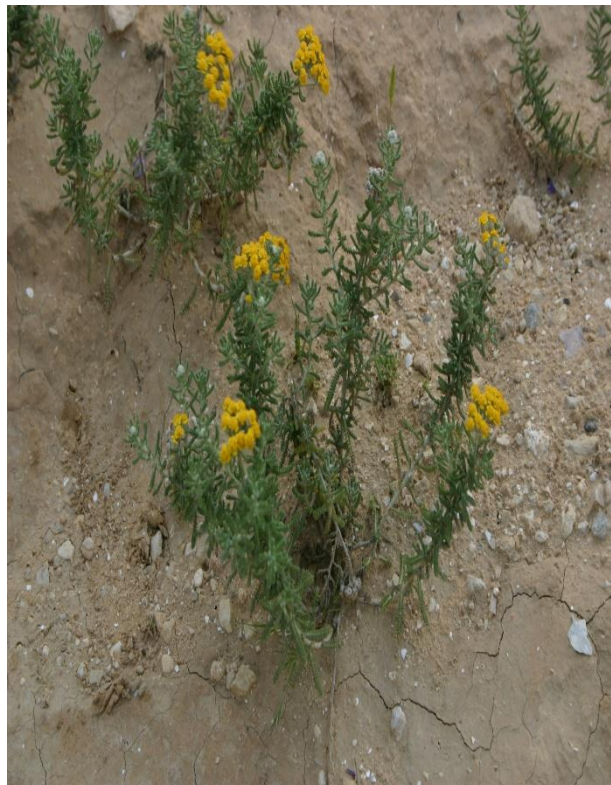
Рис. 2. Achillea santolinoides

Achillea millefolium L.- Т. обыкновенный- корневище толстое, ползучее, разветвлённое, с многочисленными тонкими, мочковатыми корнями, подземными побегами. Стебли немного численные или одиночные, прямостоячие или приподнимающиеся, прямые, реже извилистые, округлые, высотой 20-80 (до 120) см, угловато-бороздчатые, голые или слегка опушенные, ветвящиеся лишь в верхней части. Листья очередные, в общем очертании ланцетовидные или линейно-ланцетовидные дважды или трижды не до самого основания перисто-рассечённые на тонкие сегменты. Цветки мелкие белые или розовые, собраны в небольшие соцветия-корзинки. Цветёт с июня до конца лета, семена созревают в июле-сентябре. Широко распространён в Европе и Азии вид, занесён также и на другие континенты. Растёт в лесной, лесных лучах, вдоль дорог, по оврагам, по берегам водоёмов.