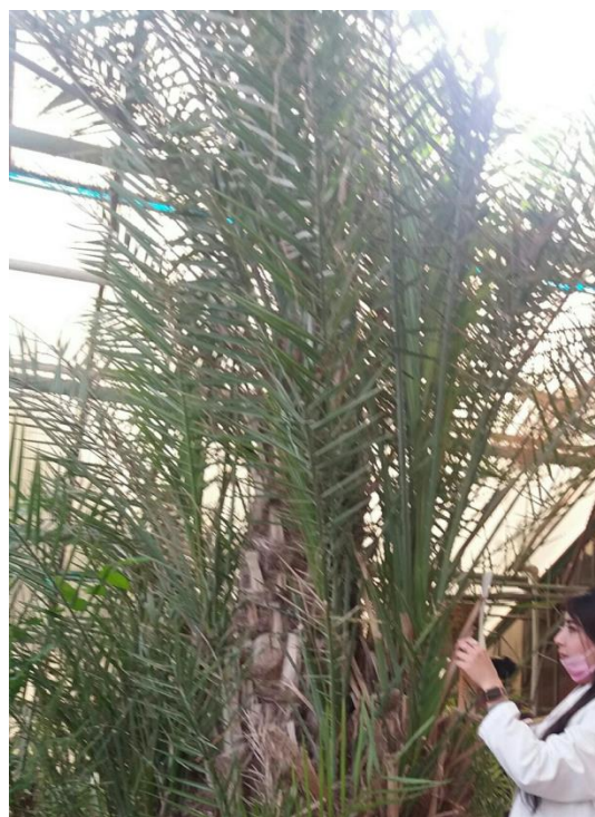
Фото 2. Общий вид финиковой пальмы