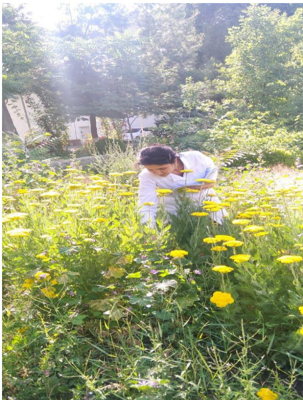
Рис.1. Achillea filipendulina